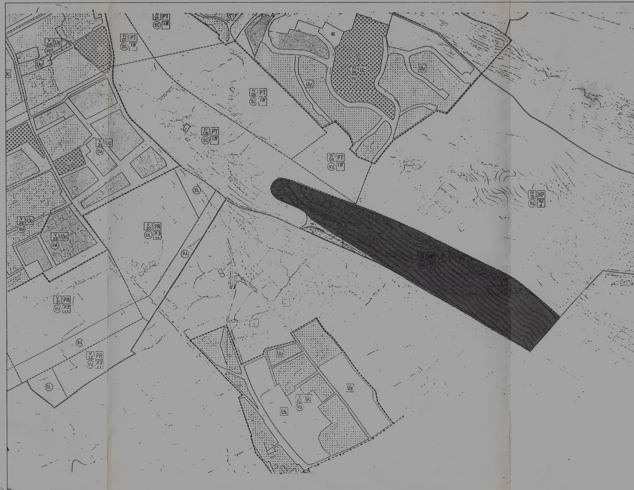
USOS PORMENORIZADOS (P.G.O.U. DE GRANADA)