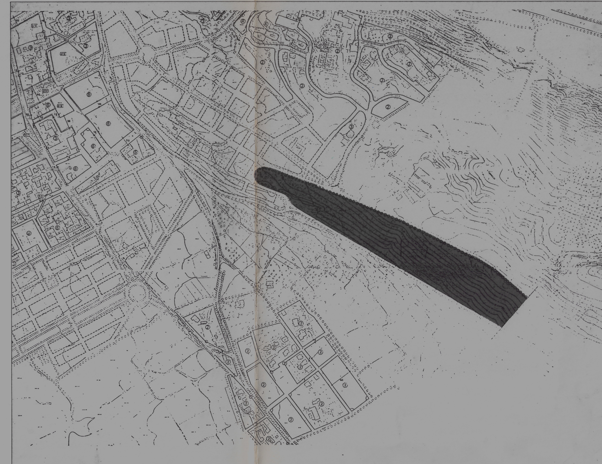
ALINEACIONES Y ALTURAS (P.G.O.U. DE GRANADA)