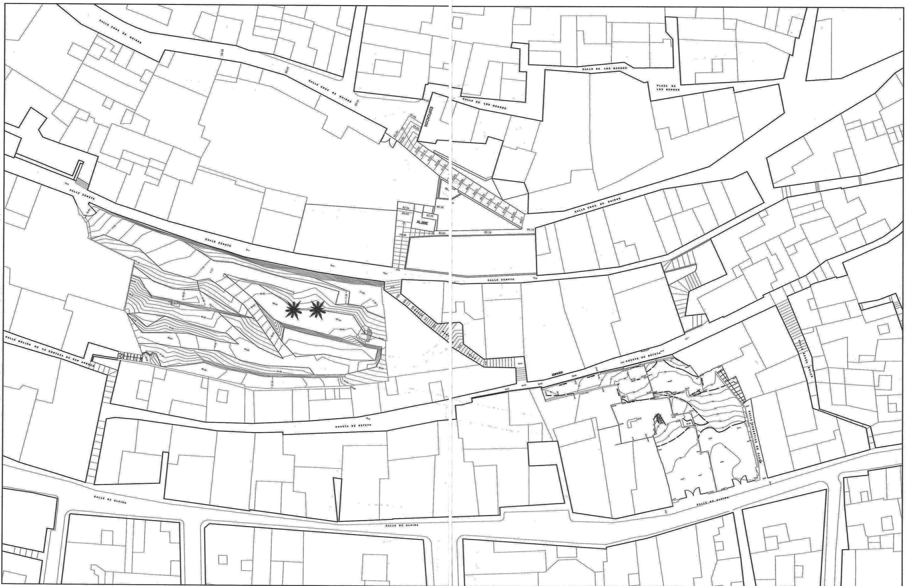
TOPOGRAFIA ESCALA 1:400