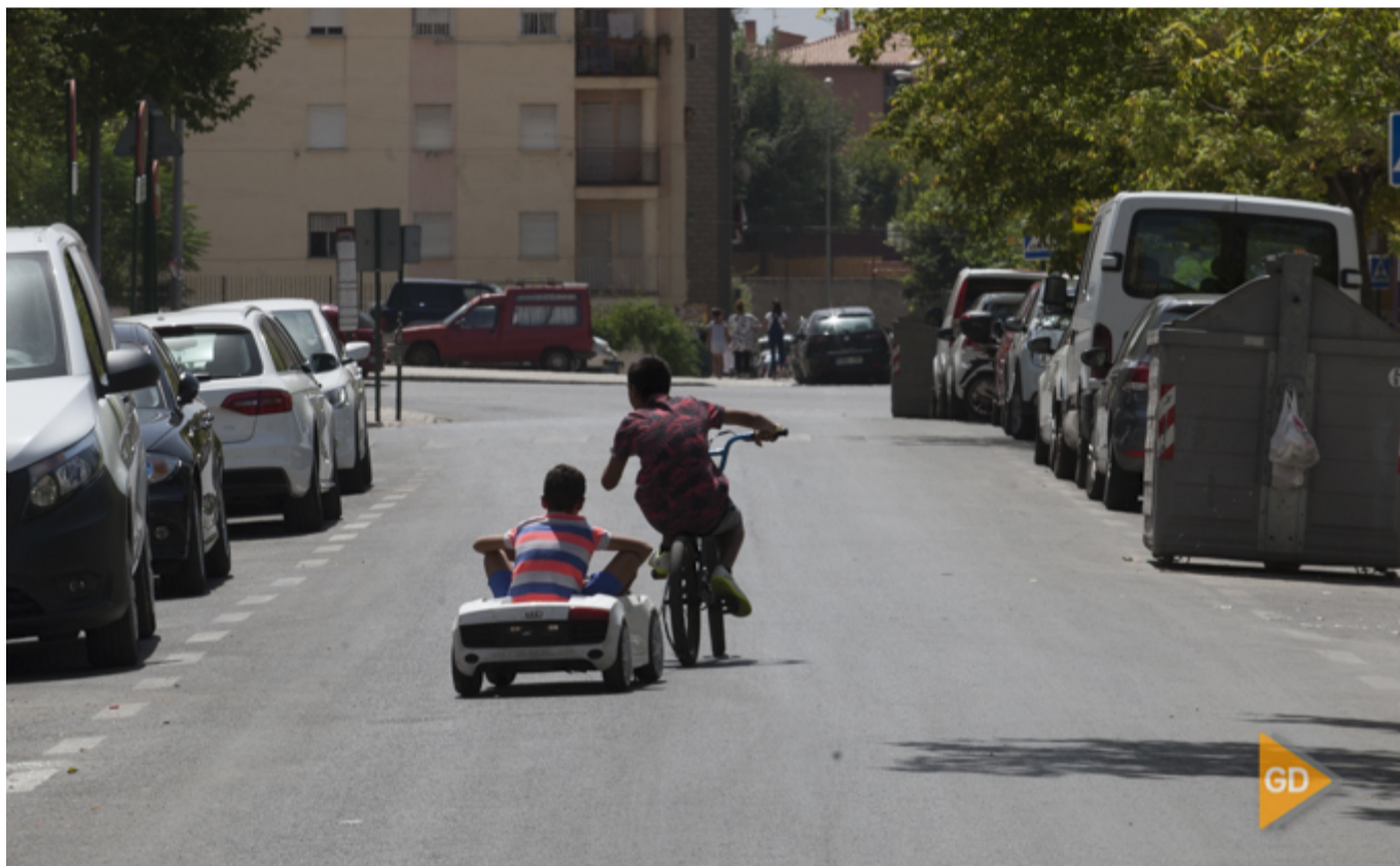
Barrio de Almanjáyar, una de las zonas en las que se va a intervenir

13/11/2018 06:00 | José L. Moreno | @morenoluaces