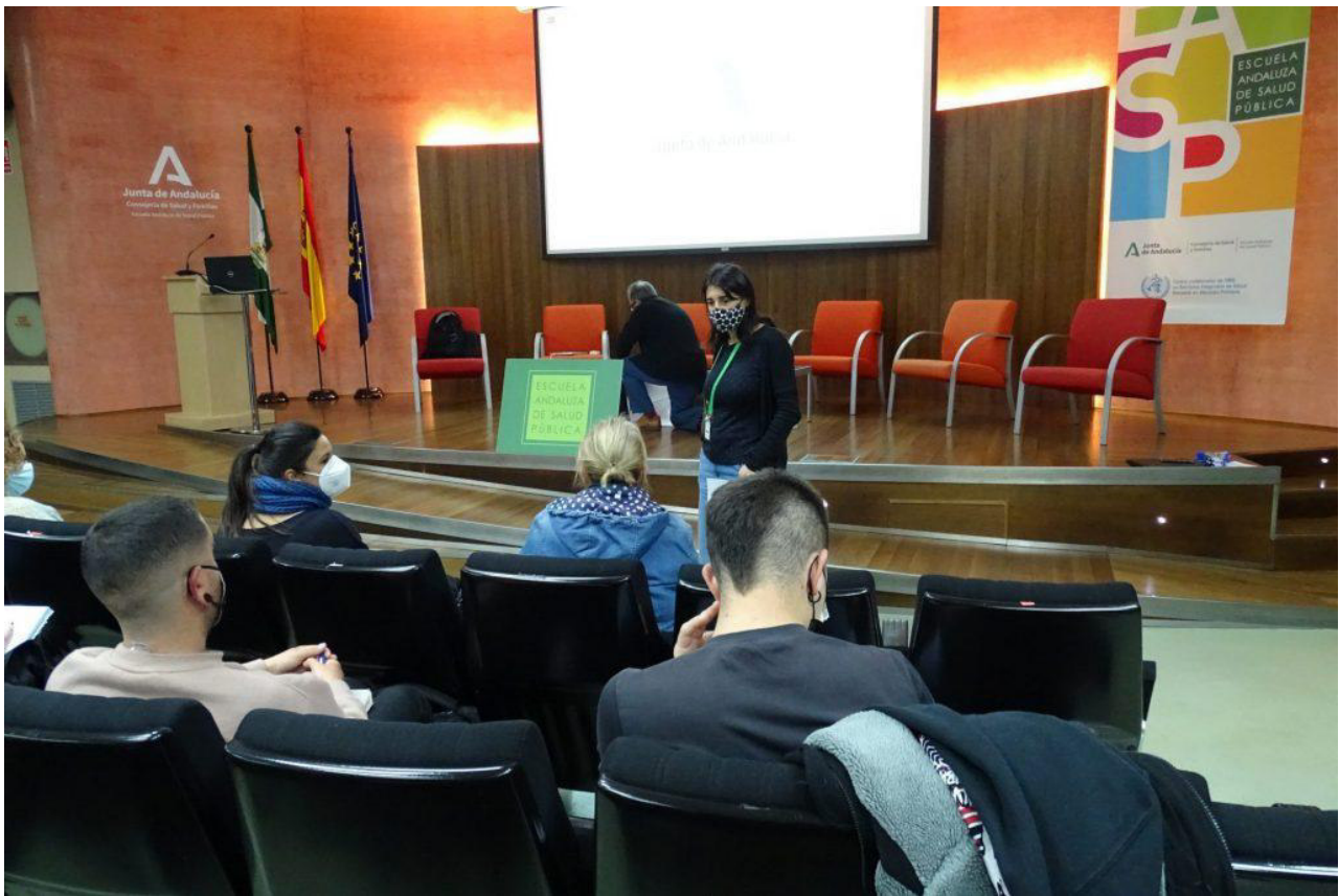
El equipo de profesionales EASP al inicio de la sesión de formación.