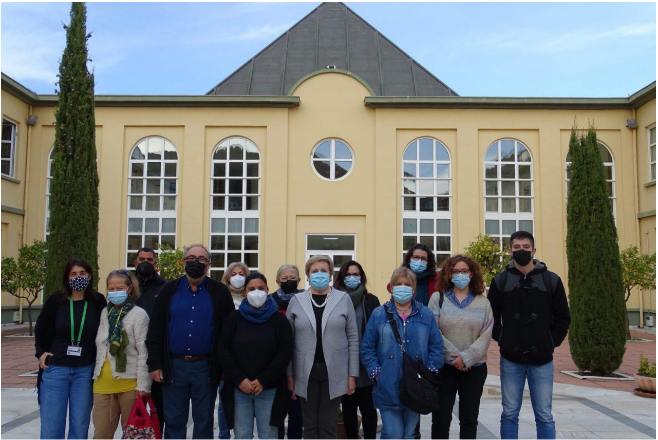
Algunos de los integrantes de la Mesa de Salud, y la Agrupación para el Desarrollo en Norte junto a profesionales de la EASP y su directora gerente a su llegada a la EASP.