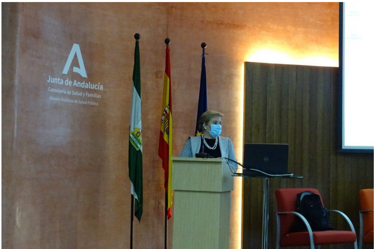
La directora gerente en el momento de bienvenida a los participantes.