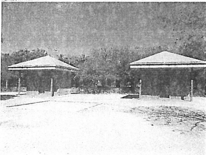
Kiosco Parque Almunia de Aynadamar