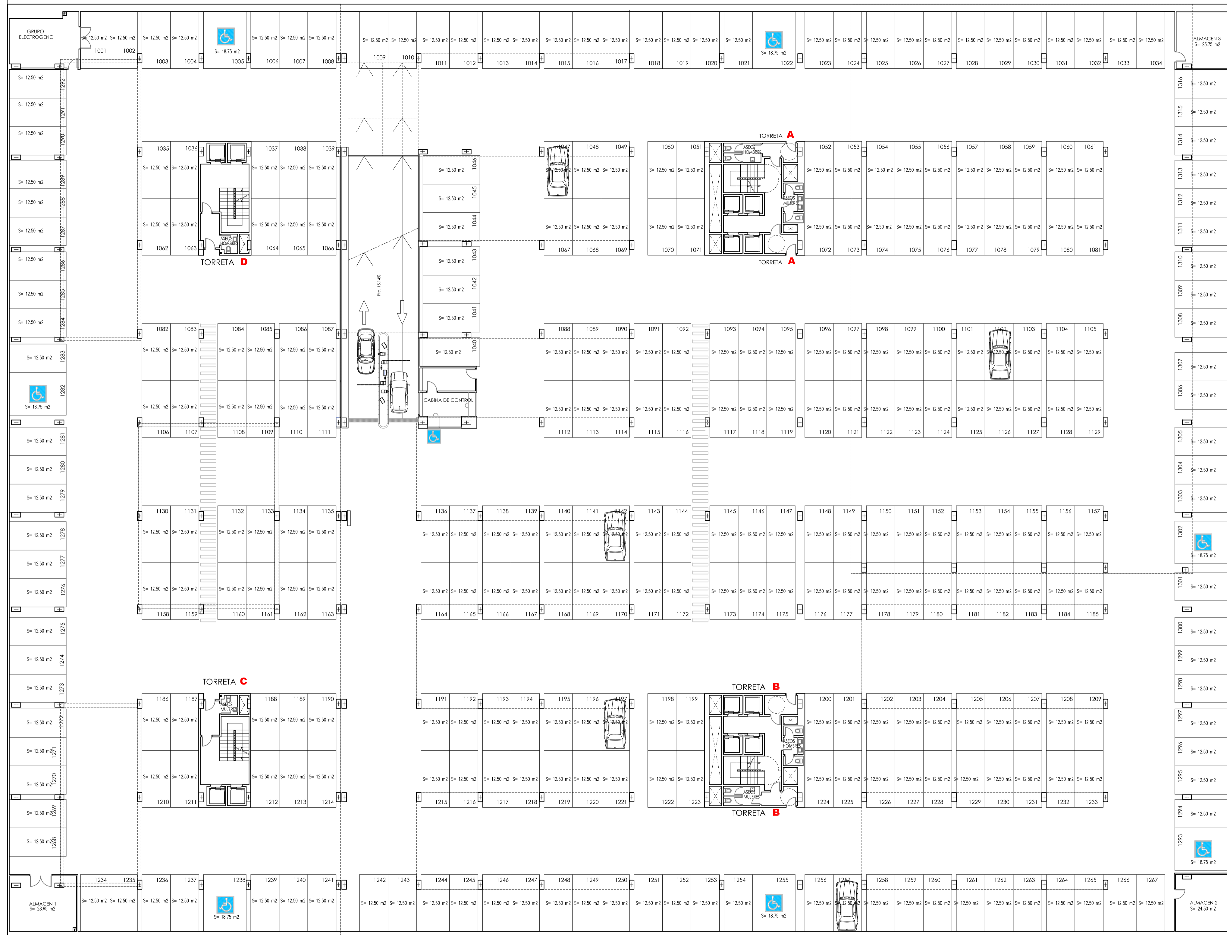
PLANTA SOTANO -1